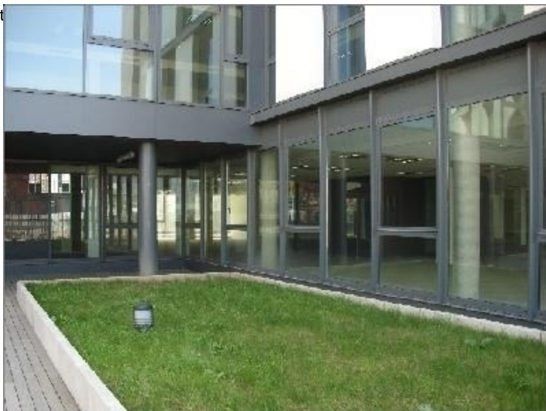
Photo du bâtiment en extérieur 2