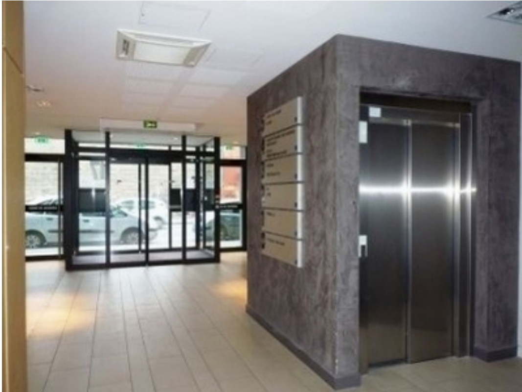
Photo du bâtiment en intérieur