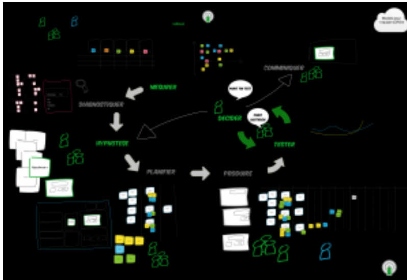
schéma provenant du site du web analyste Le sCROm pourrait se résumer en une recherche itérative agile en vue d'améliorer la performance d' un KPI . Le pilotage du processus est basé sur le Kanban, qui offre le triple avantage :